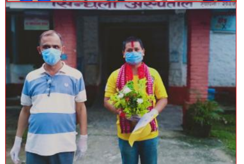
फोटोहरु:- कोरोना भाइरस संक्रमणमुक्त भई सिन्धुली अस्पतालबाट विदाइका क्रममा