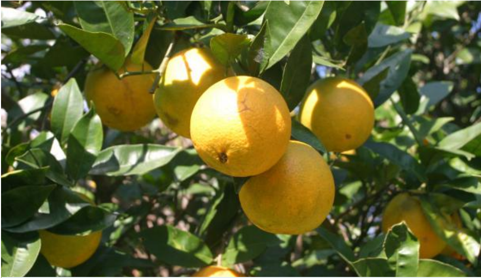
सिन्धुलीको प्रख्यात सुन्तला जातको फलफूल: जुनार

रहेको छ । । जसमा महिलाहरु १,५६,०६९ र पुरुषहरु १,४०,१२३ को संख्या छ । यस जिल्लामा ५७५८९ घरधुरिहरु रहेका छन्। यस जिल्लाको जनघनत्व सरदर ११९ प्रति वर्ग कि.मि. छ । यस जिल्लामा तामाङ जातिको वाहुल्यता रहेको छ । हायु र थामी जस्ता लोपोन्मुख अल्पसंख्यक जातिहरु पनि यस जिल्लामा बसोबास गर्दै आइरहेका छन् । यस जिल्लाको कमला र मरिणखोलाका छेउछाउका भागमा आदिवासी राई, दनुवार र माझीका व्यापक बस्तीहरु छन् भने डाँडीगुरासे गा.वि.स. को गुराँसे डाडामा नेपालकै दुर्लभ जाती हायुहरु बस्दछन् ।