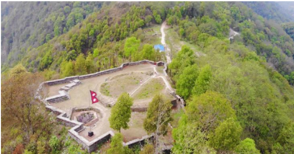
सिन्धुली गढी क्षेत्र

प्रमुख भौतिक सुविधाहरुमा जिल्लामा बिपि राजमार्गको अधिकांश क्षेत्र पर्दछ । यसै गरी मध्यपहाडी लोकमार्ग र मदन भण्डारी लोकमार्ग समेत पर्दछ । यसका अतिरिक्त बिभिन्न मौसमी सडकहरु, जिल्ला अस्पताल, कलेज सुविधा, बजार केन्द्रहरु पनि जिल्लाको सामाजिक आर्थिक विकासमा योगदान पुर्याउने भौतिक पक्षहरु हुन् ।