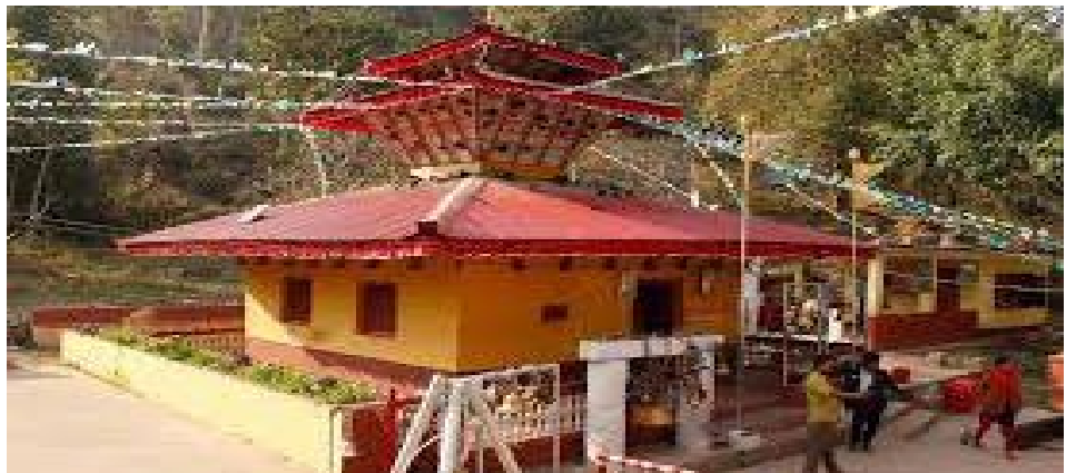
सिन्धुलीको प्रसिद्ध कमलामाई मन्दिर

महाभारत श्रृंखलाभन्दा उत्तरतिर अवस्थित रहेको तथा सुनकोशी नदीको किनारा क्षेत्रलाई गढतीर क्षेत्र भनिन्छ। सुनकोशी गाउँपालिका, गोलन्जोर गाउँपालिका र फिक्कल गाउँपालिकाका धेरै भूभाग यस क्षेत्रमा पर्दछ। यस क्षेत्रमा तुलनात्मक रूपमा सुख्खा तथा भिरालो जमिन रहेको छ। तर नदी किनाराका जमीन भूउपयोगको हिसावले यो उच्चनी क्षेत्र पनि हो। यस क्षेत्रबाट मध्यपहाडी लोकमार्ग सञ्चालित भएसँगै सेवा तथा सुविधाको पहुँच