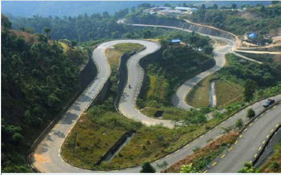
विपि राजमार्गको पिपलभन्ज्याङ क्षेत्र

तामाङ बाहुल्यता रहेको पहाडी जिल्ला भएकोले यहाँको रहनसहनमा प्रशस्त मात्रामा तामाङहरुको प्रभाव परेको पाइन्छ । प्रायः बस्तीहरु एकै स्थानमा झुरूप परेर रहेको देखिन्छ । अधिकांश घरहरु ढुङ्गा माटो र काठबाट निर्मित तथा काट र खर, 'टायल प्रयोग गरी छाना छाडिएको अवस्थामा पाइन्छन् । भूकम्प पश्चात निर्माण भएका घरहरु भने सिमेन्टेड तथा जस्ताले छाएको भेटिन्छ । भेषभुषामा यहाँका मानिसहरु कमिज, पाइन्ट, सुरुवाल टोपी, फरिया, पुटुका, चोलो आदि लगाउँदछन् ।