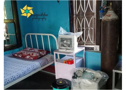
14 BEDDED ISOLATION ROOM FOR COVID-19 INFECTED PATIENTS.SINDHULI HOSPITAL, SINDHULI.